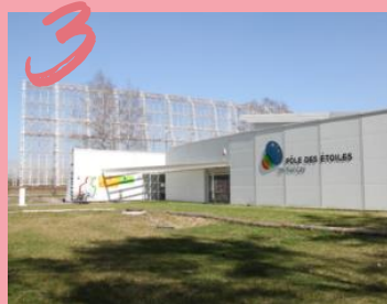
PÔLE DES ÉTOILES 10.294 VISITEURS