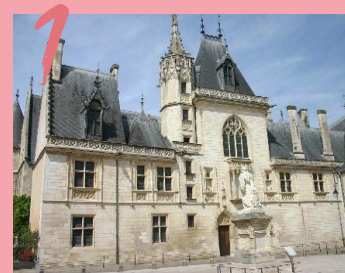
PALAIS JACQUES CŒUR 27.431 VISITEURS