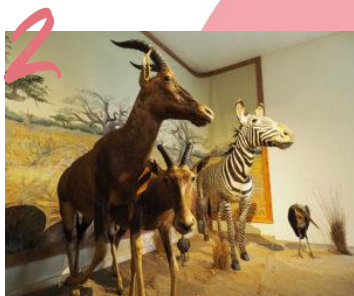
MUSÉUM DE BOURGES 24.649 VISITEURS