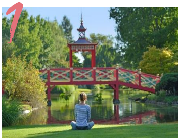
PARC FLORAL D'APREMONT 36.943 VISITEURS