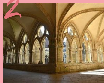
ABBAYE DE NOIRLAC 17.744 VISITEURS