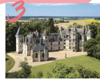
CHÂTEAU DE MEILLANT 6.543 VISITEURS

36 sites de visite et monuments du département ont répondu à l'enquête monuments, représentant de janvier à décembre 197.980 entrées (gratuites et payantes).